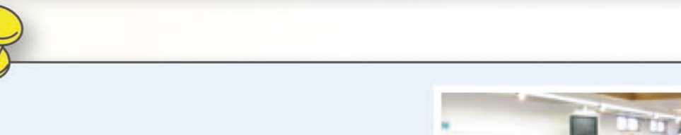
防災キャンプの様子

冷房もない体育館での一泊で災害時の苦勞も少し体験出来ましたし、他校の生徒や地域の大人たちと交流でき、みんな楽しくも勉強になった2日間でした。