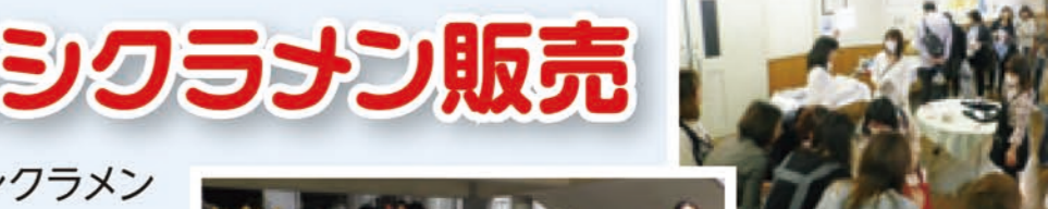
新聞紙のお皿でカレーライス